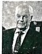
БЕДРИЦКИЙ Александр Иванович Президент Российского гидрометеорологического общества